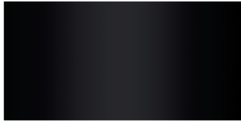
V2 Nero retroverniciato / Black back-painted / Schwarz, an der Rückseite lackiert / Negro retrobarnizado / Noir laqué au dessous