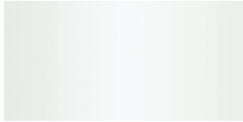
XB Extra white retroverniciato / Extra white back-painted / Extraweißes, an der Rückseite lackiert / Extra white retrobarnizado / Extra blanc laqué au dessous