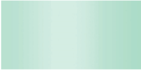
VE Verde retroverniciato / Green back-painted / Grünes, an der Rückseite lackiert / Verde retrobarnizado / Vert laqué au dessous

Tempered gloss glass / Glänzende Sicherheitsgläser / Cristales brillantes templados / Verres brillants trempés