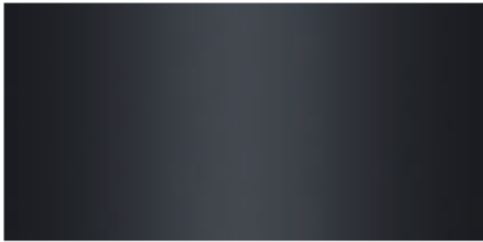
V1 Grigio antracite retroverniciato / Anthracite grey back-painted / Anthrazitgraues, an der Rückseite lackiert / Antracita retrobarnizado / Gris anthracite laqué au dessous